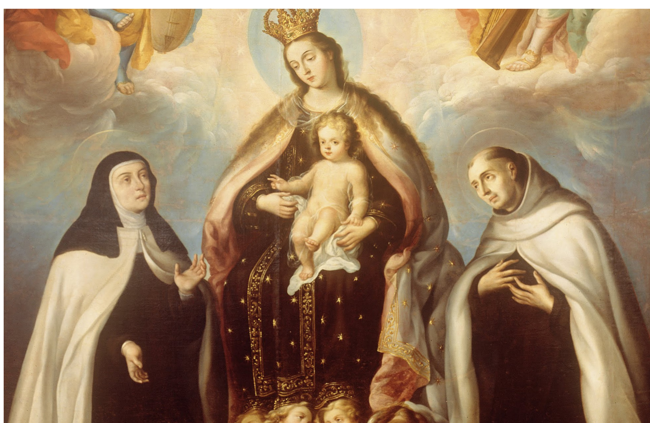
« La Vierge du Carmel avec sainte Thérèse et saint Jean de la Croix », Juan Rodríguez Juárez

« Aujourd'hui, tu as obtenu du Seigneur cette déclaration : qu'il sera ton Dieu et que tu suivras ses chemins, que tu garderas ses commandements et que tu écouteras sa voix. » (Dt 26, 17)