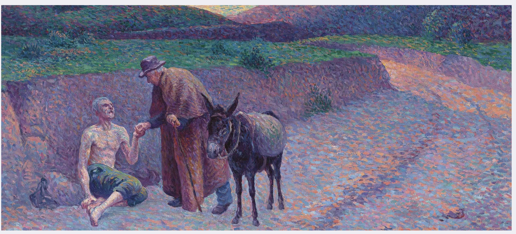
« Le bon samaritain » Maximilien Luce, 1896

« Seigneur, quand est-ce que nous t'avons vu avoir faim et soif, être nu, étranger, malade ou en prison, sans nous mettre à ton service ? » (Mt 25, 44)