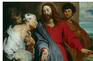
« Le Christ guérissant le paralytique » Anthony van Dyck

Comment puis-je aujourd'hui imiter Jésus en intercédant pour les autres ?