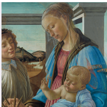
« Madone de l'Eucharistie » Botticelli, 1470

Comment puis-je demeurer en présence de Dieu au long du jour ?