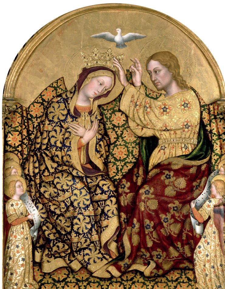
Gentile da Fabriano « Le Couronnement de la Vierge »