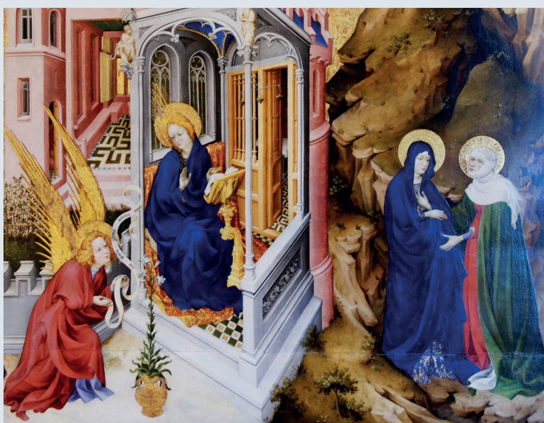
« L'Annonciation » Melchior Broederlam, 1398, Dijon

« Nul n'a communié comme Marie à cet élan vers le Père que fut la vie intérieure du Christ. » Visage de la Vierge, p. 42