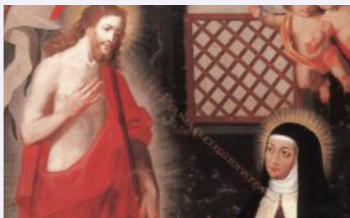
Vision du Ressuscité par Thérèse