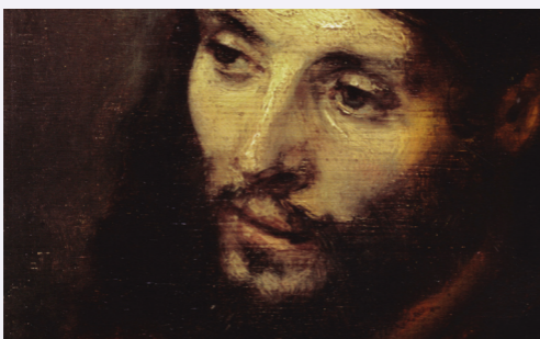
Le Christ (Rembrandt)

« Ceux qui ne prient pas encore, je les conjure de ne pas se priver d'un bien si précieux. Là, rien à craindre et tout à désirer. On apprendra peu à peu à connaître le chemin du ciel si l'on y marche avec persévérance, j'attends tout de la miséricorde de Dieu : ce n'est pas en vain qu'on le choisit pour ami. » Vie 8,5