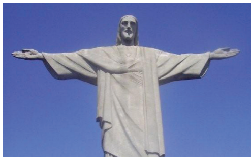
Statue du Christ Rédempteur qui domine Rio de Janeiro

« Je ne vous demande que de Le regarder... Lui ne vous quitte pas des yeux : est-ce beaucoup vous demander que de perdre de vue les choses extérieures pour Le regarder, Lui, de temps en temps ? »