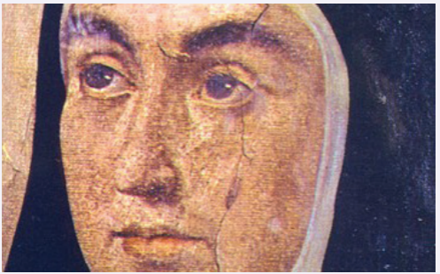
Portrait de sainte Thérèse

« Avant de savoir m'aider moi-même, j'avais le très vif désir d'être utile aux autres : tentation très fréquente chez les commençants, mais qui, à moi, me réussit. » Vie 7,10