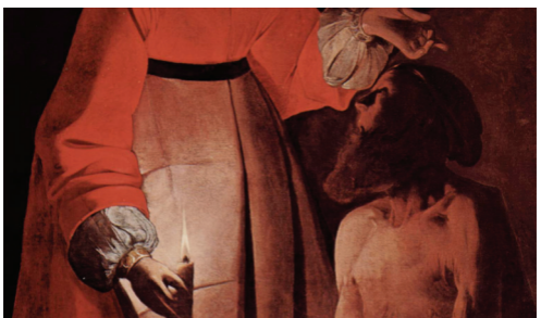
Job raillé par sa femme (Georges de La Tour)

« On ne me jugeait pas si mal parce qu'on me voyait, toute jeune que j'étais, et en de nombreuses circonstances, m'isoler souvent pour prier, lire beaucoup, parler de Dieu, toujours prête à faire peindre son image en divers endroits, arranger mon oratoire de manière à susciter la dévotion, ne dire du mal de personne, et autres choses analogues qui avaient les apparences de la vertu; et dans ma vanité je savais m'estimer pour les choses que le monde juge dignes d'estime. » Vie 7,2