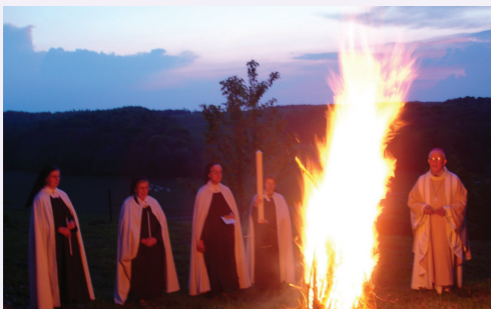
Vigile pascale au Carmel

« Le Seigneur me dit : Hélas, ma fille, combien rares sont ceux qui m'aiment vraiment ! ... Sais-tu ce que c'est que m'aimer vraiment ? C'est comprendre que tout ce qui ne m'est pas agréable est vain. Tu verras ce que tu ne comprends pas pour le moment, aux progrès que fera ton âme. » Vie 40,1