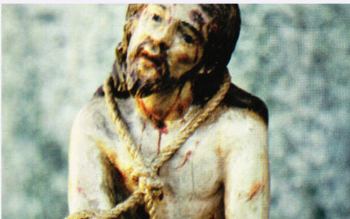
Statuette du Christ aux liens liée à la conversion de Thérèse