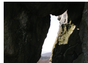
Ombre de mort

« Dieu qui est riche en miséricorde, à cause du grand amour dont Il nous a aimés, alors que nous étions morts à cause de nos fautes, nous a fait revivre dans le Christ. » Ephésiens 2,4