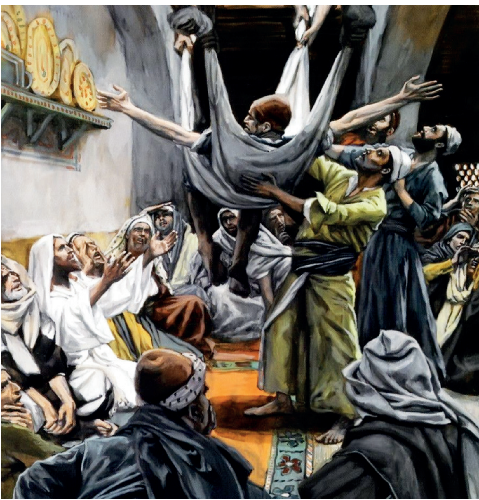
« Le paralytique descendu du toit », James Tissot

Je m'efforce de chercher la beauté dans les personnes que je rencontre aujourd'hui.