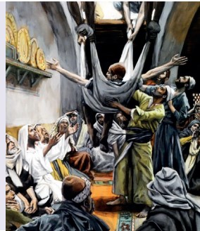
« Le paralytique descendu du toit », James Tissot