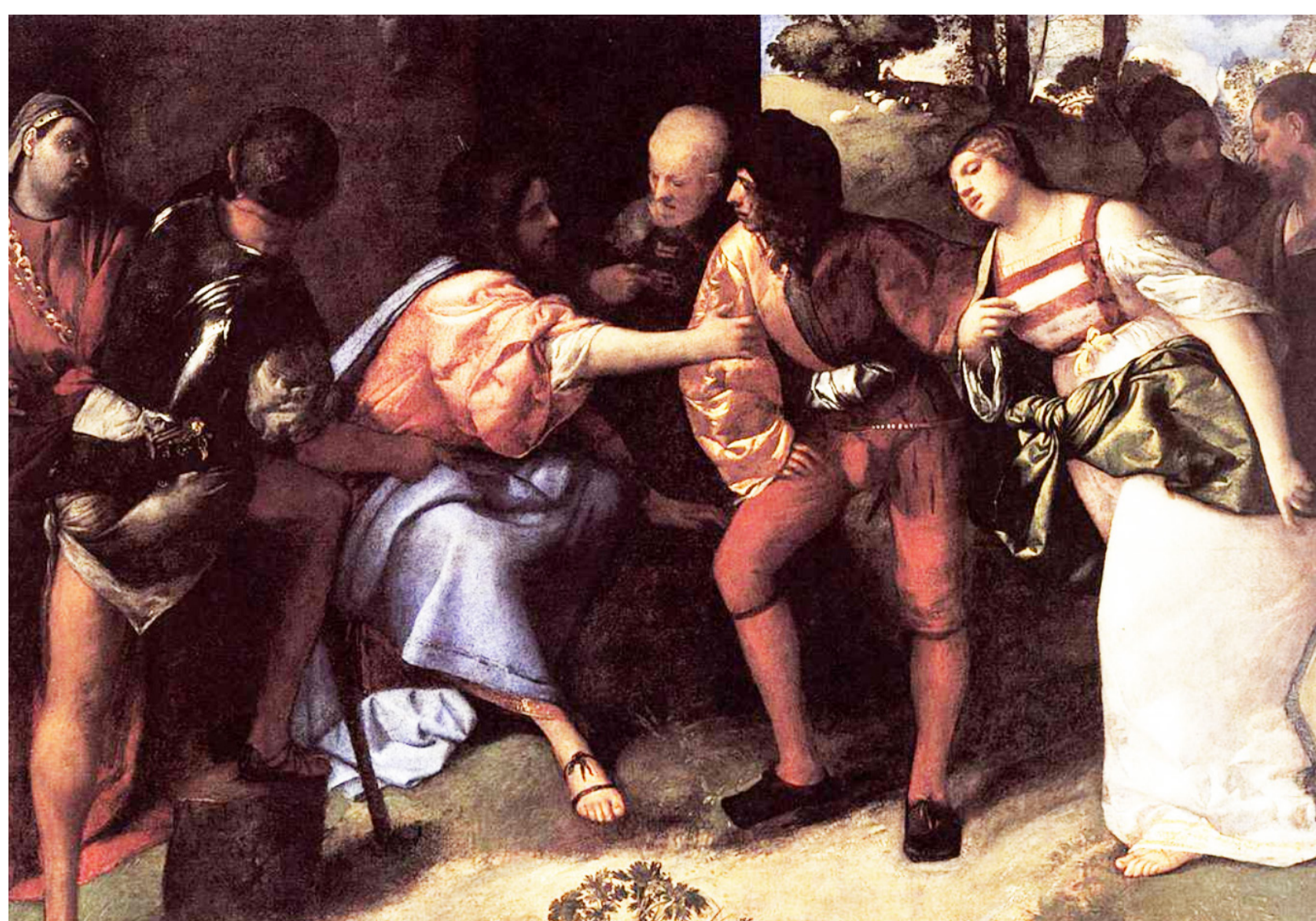
« Jésus et la femme adultère » - Titien