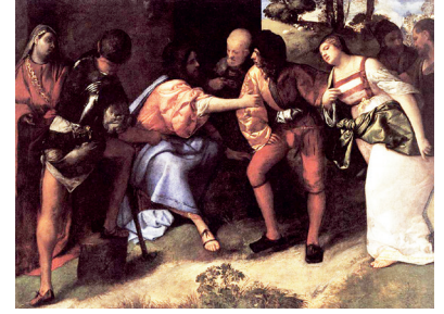
« Jésus et la femme adultère » - Titien

Je demande au Seigneur de ne pas porter de jugement sur autrui mais de regarder l'autre avec les yeux de Jésus.