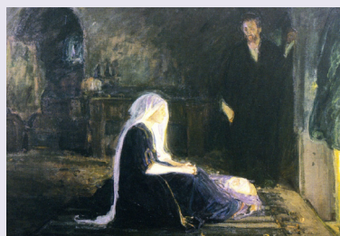
« La Sainte Famille » Henry Ossawa Tanner