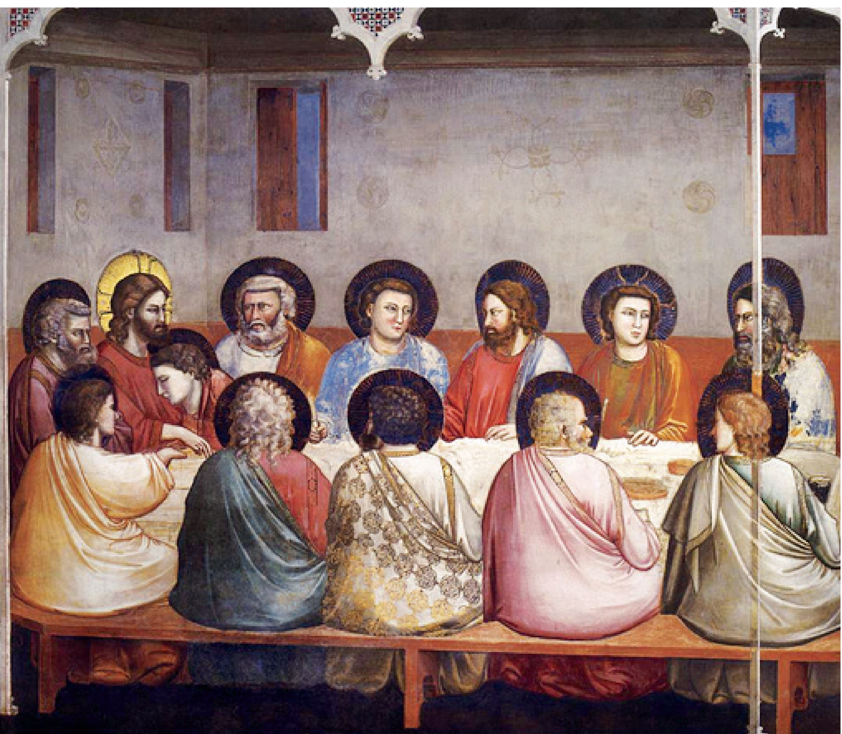
« La dernière Cène » Giotto

Mardi 1 er avril : Recueillir son amour débordant