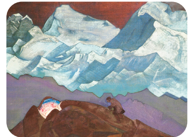
Nicholas Roerich « Fleur de feu »

Avec confiance nous pouvons confier notre semaine à l'Esprit-Saint.