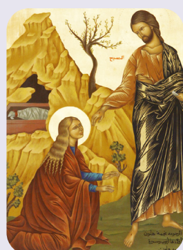
Icône dans la cathédrale melkite de Haïfa : Marie-Madeleine avec le Christ ressuscité