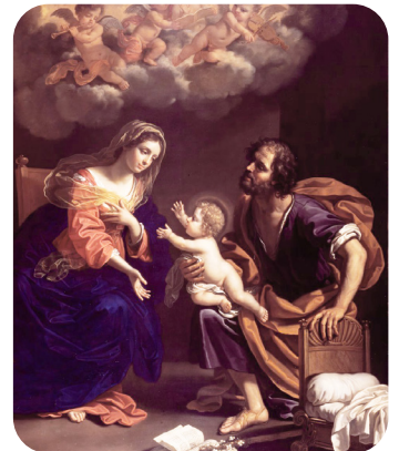
« La Sainte Famille » Benedetto Gennari

Je confie ma propre famille à la sainte famille de Nazareth.