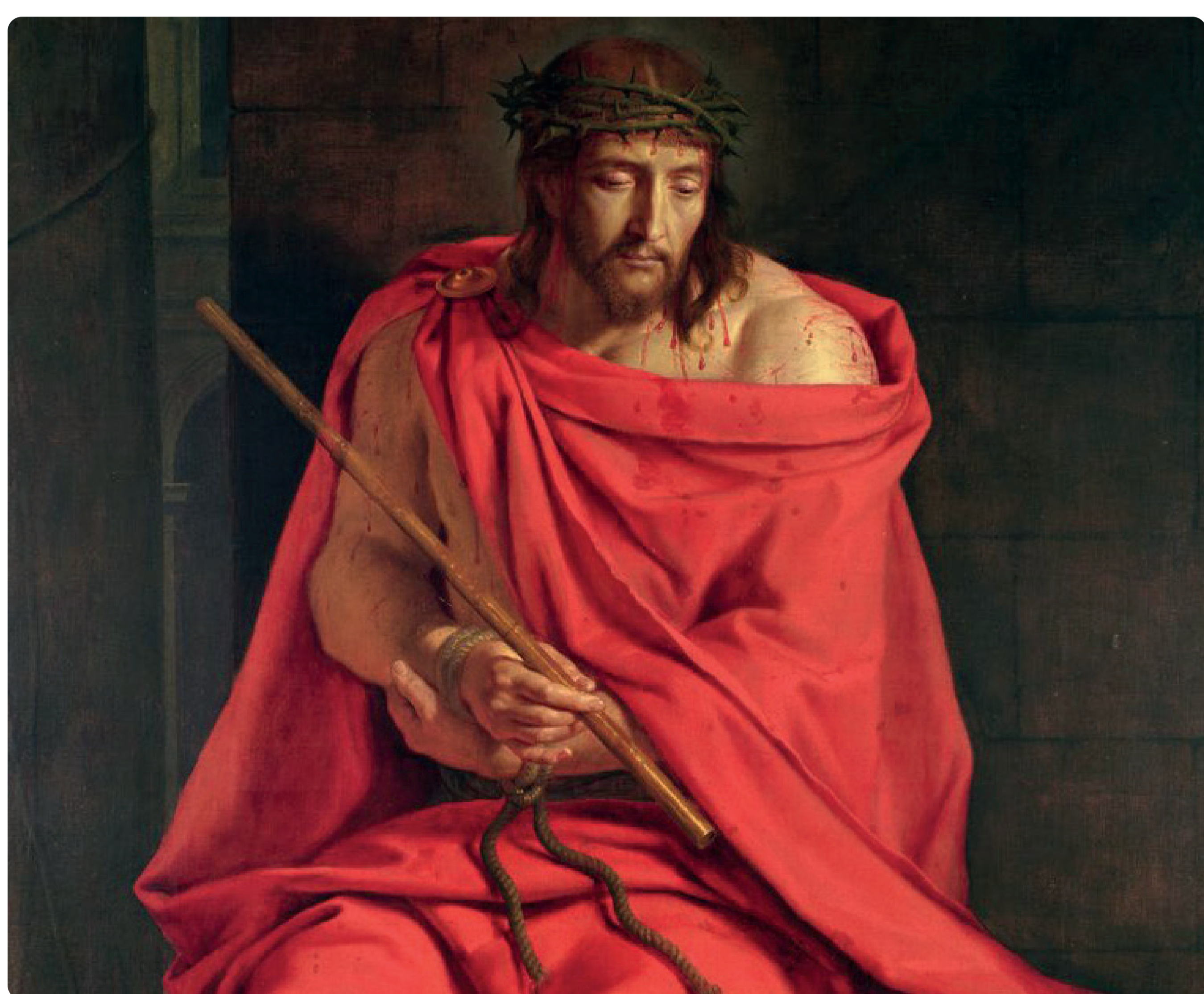
« Jésus moqué » Philippe de Champaigne

« Demeurez en mon amour. Si vous gardez mes commandements, vous demeurerez en mon amour (...) Voici quel est mon commandement : vous aimer les uns les autres comme je vous ai aimés. » (Jn 15, 9-10.12)