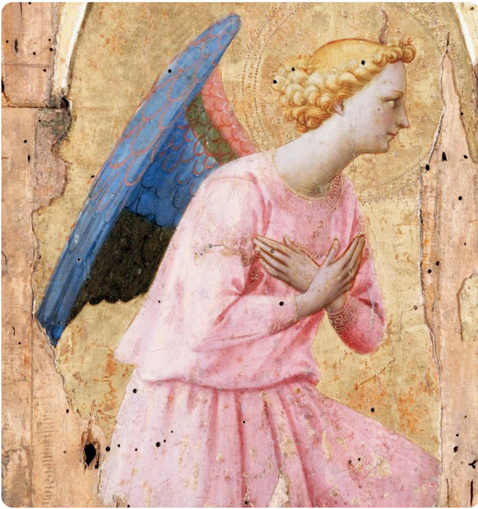
« L'Ange de l'Annonciation » Fra Angelico

Lundi 16 mars : la joie de la louange et de la gratitude