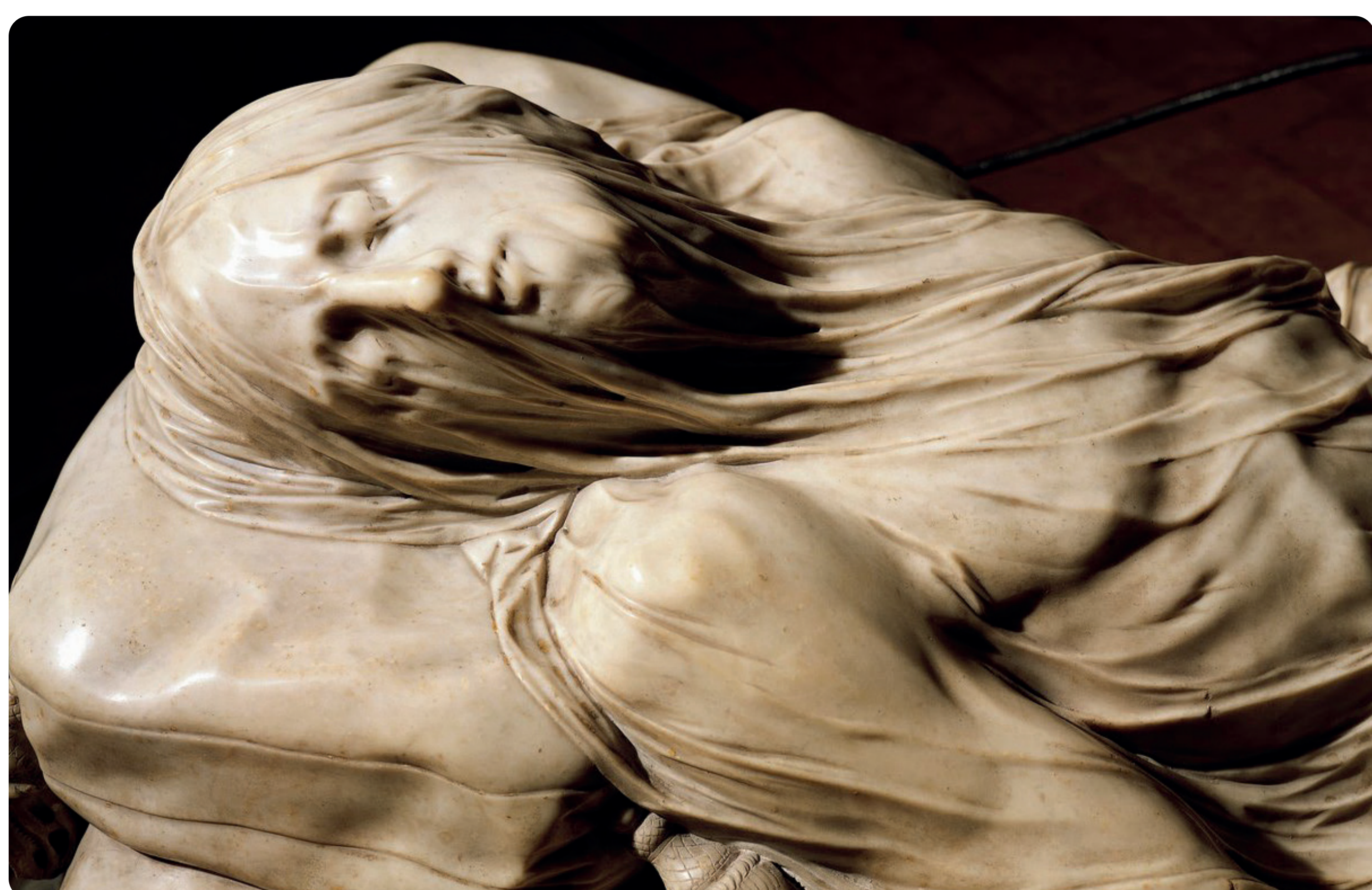
« Le Christ voilé » Giuseppe Sanmartino

« Montrez-vous bons et compatissants les uns pour les autres, vous pardonnant mutuellement, comme Dieu vous a pardonné dans le Christ. » (Ep 4,32)