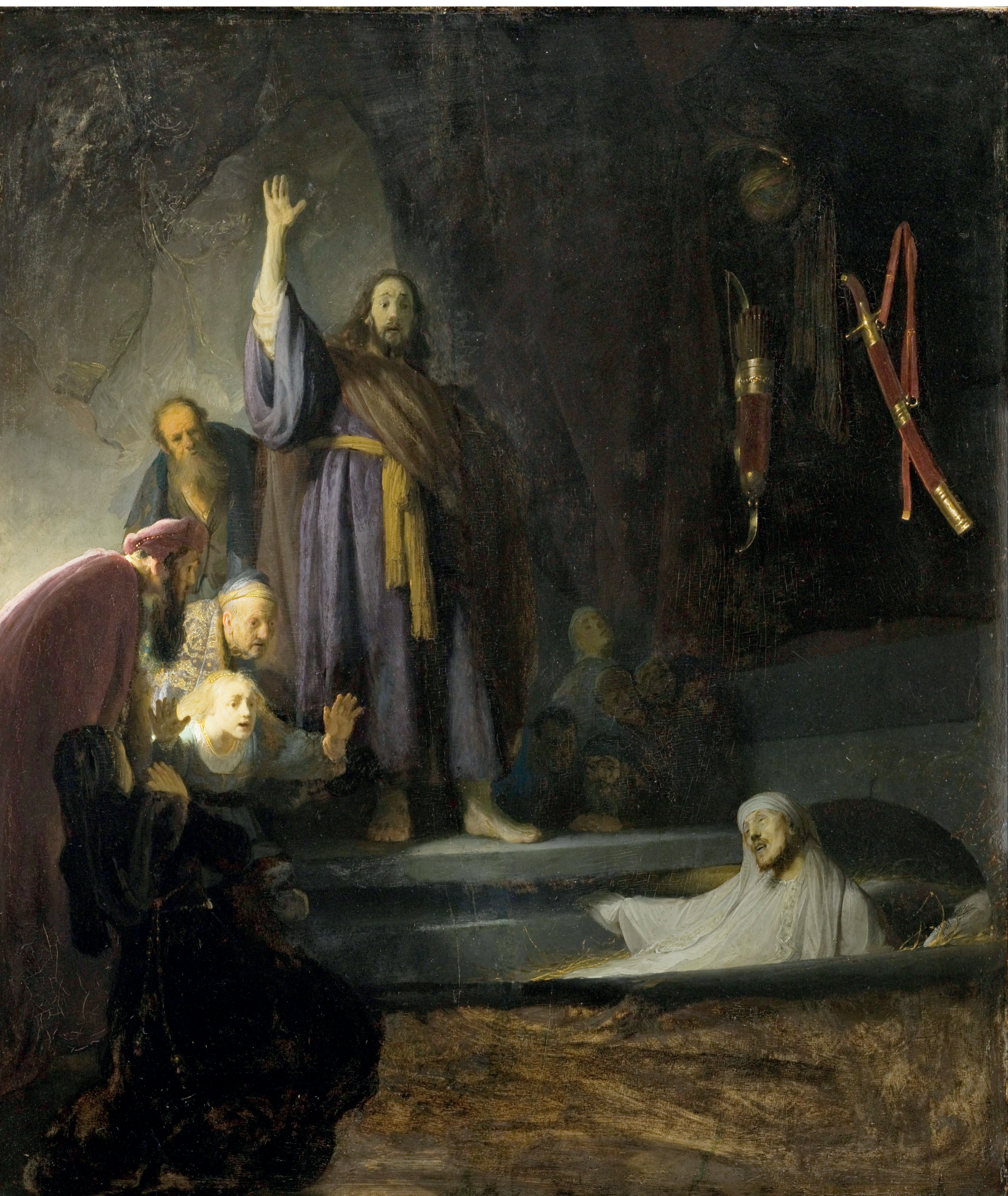
« Résurrection de Lazare » Rembrandt