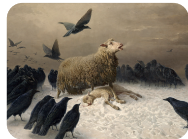
« Angoisse » August Friedrich Schenck

Pendant Sa Passion, le Christ m'enseigne à aimer par-dessus tout, la volonté du Père, volonté d'amour, de salut pour tout homme. Moi aussi, je peux me mettre à son service pour que l'amour du Père parvienne à ceux qui m'entourent.