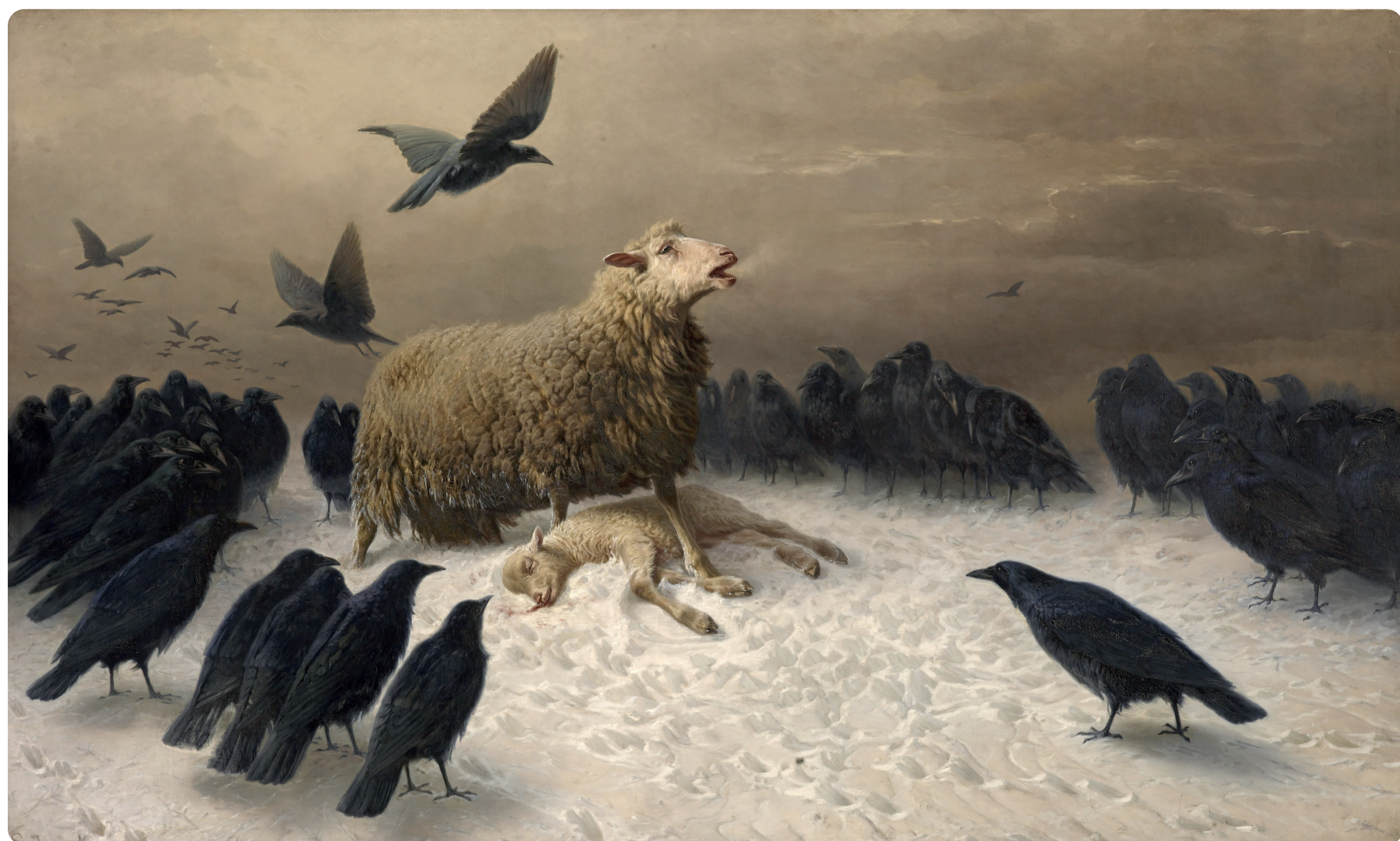
« Angoisse » August Friedrich Schenck

« Je ne fais rien de moi-même, mais je dis ce que le Père m'a enseigné, et celui qui m'a envoyé est avec moi ; Il ne m'a pas laissé seul parce que je fais toujours ce qui lui plaît. » (Jn 8, 28-29)